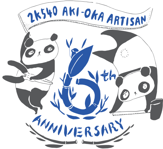
Illustration : Haruka Shinji