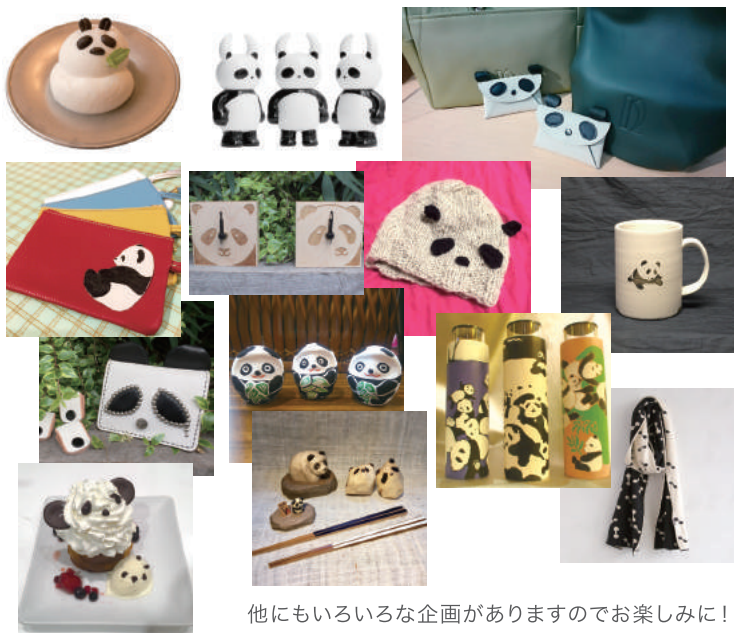
他にもいろいろな企画がありますのでお楽しみに！